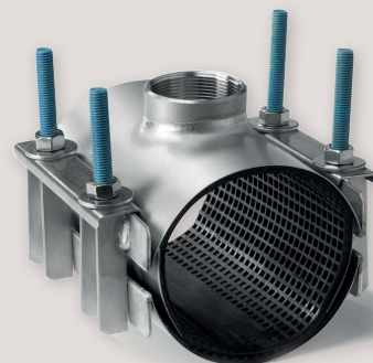
Anborringssock från Proco Services.